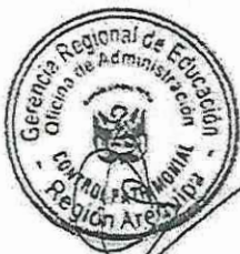
CUADRO N° 01

4.2. La relación de lotes, características, estado y precio base de los bienes, se describe en el siguiente cuadro: